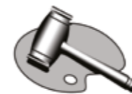
ASSOCIAZIONE NAZIONALE CASE D'ASTE

La violazione di quanto stabilito dal presente regolamento comporterà per i soci l'applicazione delle sanzioni di cui all'art. 20 dello statuto ANCA.