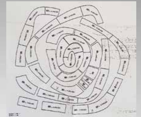
Table n. 31 from the 38 Tables series produced by Ron Arad Studio at Marzorati Rochetti, Cantù

Si ringrazia vivamente lo Studio Ron Arad per la conferma dell'autenticità.